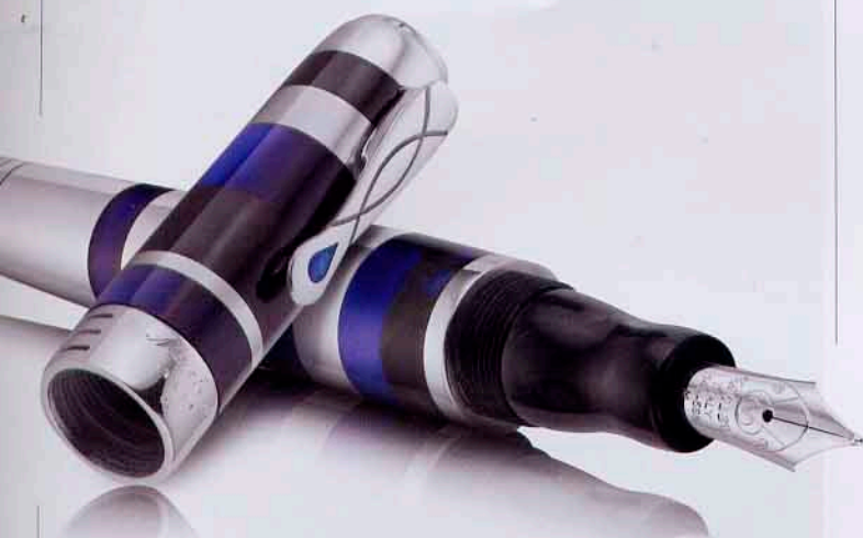
Le Rêve di Marlen

Infine, per una donna amante del design c'è Mokina di Mazzuoli , una penna che s'ispira simpaticamente alla forma di una caffettiera e può essere indossata grazie a un laccio: è realizzata in alluminio ed è disponibile in versione sfera e stilografica, oltre che al naturale, anche nei colori antracite, bronzo, rosa, perla e blu (da 135 a 150 euro). Molto di moda e indicata a persone attente alle nuove tendenze, la collezione E-motion resina Pavé e Parquet di Faber-Castell offre un'ampia scelta tra colorazioni e fantasia della trama. L'effetto geometrico disegnato al laser sul fusto in resina impreziosisce la linea leggermente bombata di stilografica, sfera, roller e mina (da 55 a 105 euro).