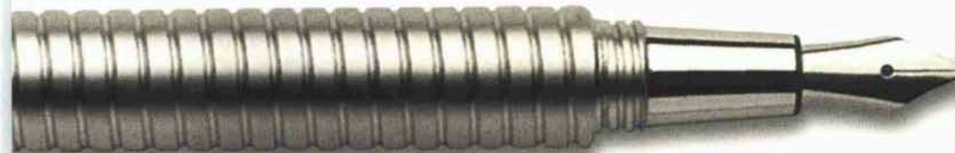
SI ISPIRA AL MONDO DELL'OFFICINA LA STILOGRAFICA MADREVITE IN ALLUMINIO CROMATO DELLA SERIE «WRITING TOOLS» DI GIULIANO MAZZUOLI. ANCHE IN VERSIONE MINI. (135 EURO). INFO: WWW.MAZZUOLI.IT.