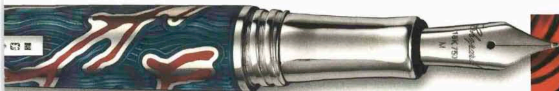
STILOGRAFICA CHOPARD «CORAIL» IN ARGENTO 925 CON FUSTO IN SMERALDO CHE RIPRODUCE IL CORALLO. EDIZIONE LIMITATA A 200 ESEMPLARI, DISPONIBILE ANCHE ROLLER (1.250 EURO). INFO: WWW.CHOPARD.COM.

come i LIBRI scelti per quattro originali letture d'autunno